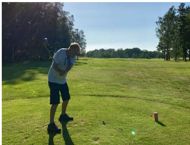
Ett utslag vid fjärde hålet på den vackra golfbanan i Lundsbrunn.

Efter fika och påfyllning av vatten var det så dags att få prova på att spela golf på riktigt. Indelade i mindre lag, vart och ett förstärkt av en erfaren spelare från klubben, spelades en så kallad ”scramble”. En lekfull tävlingsform där alla i laget medverkar till ett gemensamt resultat. Sex av klubbens totalt 18 hål på den stora banan spelades och när resultatet presenterades kunde ett vinnande lag koras. Det var ett gäng mycket nöjda och glada hyresgäster som därefter tackade för en härlig kväll på golfbanan.