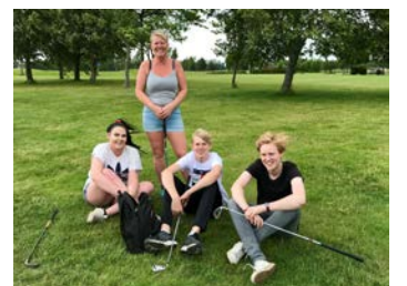
Populär golfkväll väckte stort intresse.