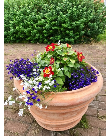
Sommarblommor som förgyller.