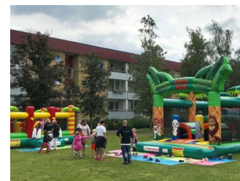
Vikingaskoj lockade många till Prästgårdsängen.

Efter en något tveksam inledning med regn och åska runt lunch kom solen åter och med den barn och ungdomar från hela kommunen. Detta var för andra året i rad som det populära evenemanget genomfördes.