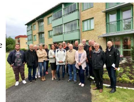
Styrelse och medarbetare framför Hjälmen 2.

Den 12 juni gjorde huvuddelen av styrelsen tillsammans med samtliga medarbetare en rundtur till bolagets alla bostadsområden för att bekanta sig med varandra och för att ge styrelsen möjlighet att lära sig mer om GöteneBostäders verksamhet.